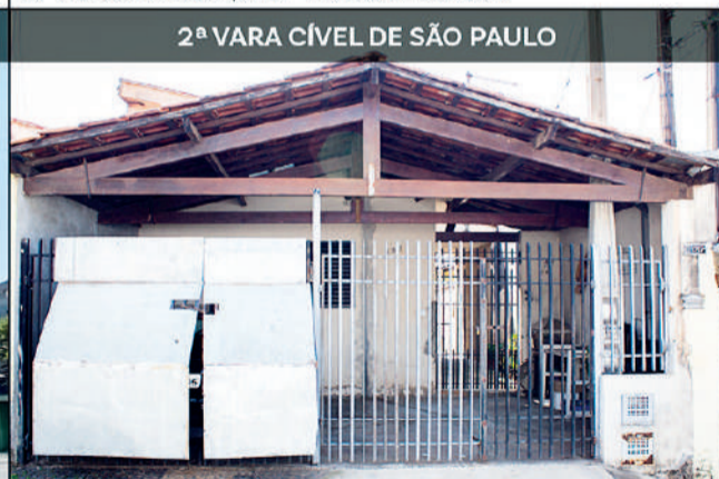
2ª VARA CÍVEL DE SÃO PAULO CASA EM NOVA ODESSA/SP 2º LEILÃO | 19/02/2024 - 11:00

Processo: 1007273-38.2022.8.26.0100 2ª Vara Cível do Foro Central de São Paulo - Estado de São Paulo