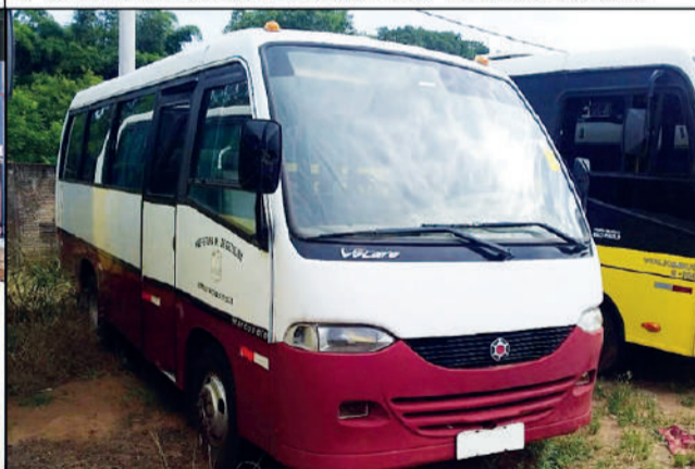
PREFEITURA - GETULINA/SP 📅 22/01/2024 - ÀS 10:00

Processo: 1000179-06.2017.8.26.0394 1ª Vara Judicial de Nova Odessa - Estado de São Paulo