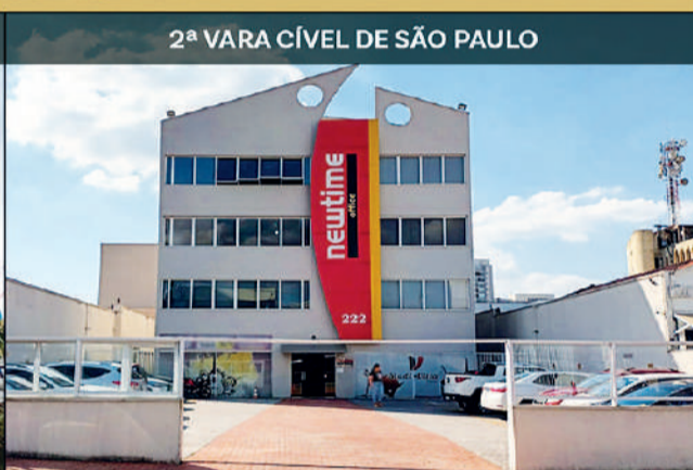
2ª VARA CÍVEL DE SÃO PAULO SALAS COMERCIAIS EM JUNDIAÍ/SP 2º LEILÃO | 18/01/2024 - 14:00

Processo: 4015780-07.2013.8.26.0114 8ª Vara Cível de Campinas - Estado de São Paulo