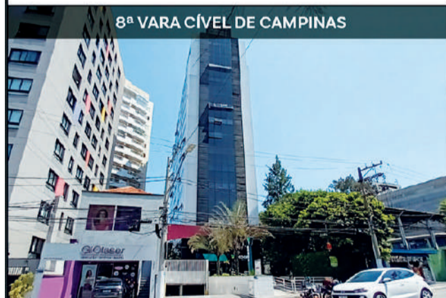
8ª VARA CÍVEL DE CAMPINAS SALA COMERCIAL EM SÃO PAULO/SP 2º LEILÃO | 18/01/2024 - 14:00

Processo: 1007273-38.2022.8.26.0100 2ª Vara Cível do Foro Central de São Paulo - Estado de São Paulo