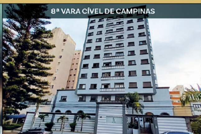
8ª VARA CÍVEL DE CAMPINAS APARTAMENTO EM CAMPINAS/SP 2º LEILÃO | 10/01/2024 - 10:00