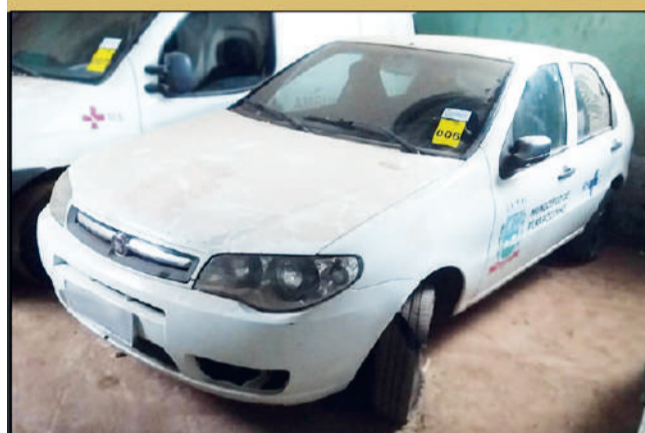
PREFEITURA - PIRAPOZINHO/SP 📅 08/01/2024 - ÀS 10:00

Veículos com direito a documento: FORD/FI2000 160, FIAT/PALIO FIRE ECONOMY, GM/CELTA 2P LIFE, ÔNIBUS M.BENZ/INDUSCAR GI R 500. Sucata de materiais diversos. Sucata eletrônica. Sucata de equipamentos hospitalares. Máquinas de costura, armários e eletrodomésticos diversos. Maquinários: Espargidor de massa asfáltica rebocável, pá carregadeira FIATALLIS, entre outros. Relação completa e fotos, no site. Condições de pagamento à vista + 5% de Comissão do Leiloeiro Oficial - José Luís Teixeira Quenca - JUCESP 1074 . O leilão será realizado online, através das Plataformas: www.sumareleiloes.com.br e www.josequencaleiloeiro.com.br . Consulte o edital completo. [4155]