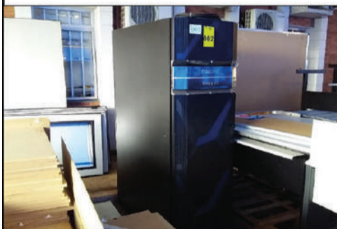
EMBRAPA AGRICULTURA DIGITAL