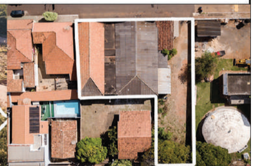
📅 21/02/2024 • ÀS 14:00

Lotes de terrenos localizados na cidade de Fartura/SP, com metragens que variam de 178,49 m² à 10.056,19 m². Relação completa, fotos, matrículas e demais informações no site. Condições de pagamento à vista + 5% de Comissão do Leiloeiro Oficial - Gustavo Moretto Guimarães de Oliveira - JUCESP 640. O leilão será realizado exclusivamente online, através da Plataforma: www.sumareleiloes.com.br . Consulte o edital completo. [3927]