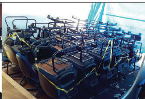
📅 05/02/2024 • ÀS 13:00

Equipamentos de informática e eletrônicos: RACK DELL EMC UNITY XT, RACK SGI UV 2000. Móveis de escritório. Aparelhos de ar condicionado de diversas marcas, modelos e potências, entre outros. Relação completa e fotos no site. Condições de pagamento à vista + 5% de Comissão do Leiloeiro Oficial - Pedro Henrique Erbolato Moraes de Oliveira - JUCESP 1260 . O leilão será realizado exclusivamente online, através das Plataformas: www.sumareleiloes.com.br e www.pedrooliveiraleiloeiro.com.br . Consulte o edital completo. [4089]