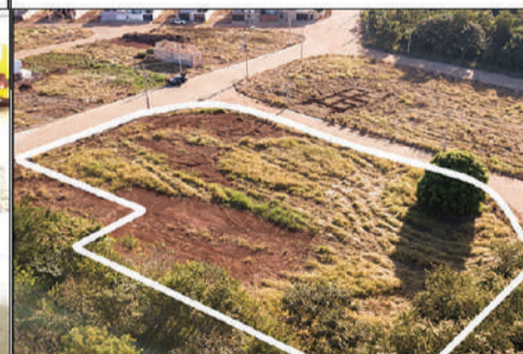
PREFEITURA - FARTURA/SP