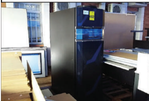
EMBRAPA AGRICULTURA DIGITAL