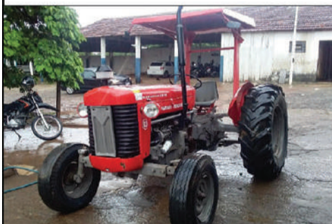
PREFEITURA - PROMISSÃO

Veículos com direito a documento: VW/GOL 1.6 - 99/00, I/PEUGEOT PARTNER FURGÃO - 99/99, FIAT/PALIO FIRE - 03/03, FIAT/LINEA LX 1.8 DUAL - 10/11, VW/FUSCA 1300 - 80/80, I/HYUNDAI SANTAFE GLS V6 - 09/10, entre outros. Relação completa e fotos, no site. Condições de pagamento à vista + 5% de Comissão do Leiloeiro Oficial - Weider André Henojo - JUCESP 1029. O leilão será realizado exclusivamente online, através da Plataforma: www.sumareleiloes.com.br . Consulte o edital completo. [4211]