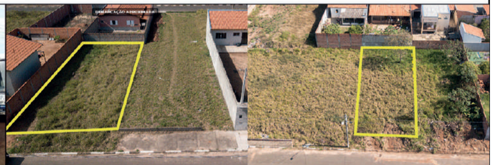
PREFEITURA - SÃO PEDRO/SP