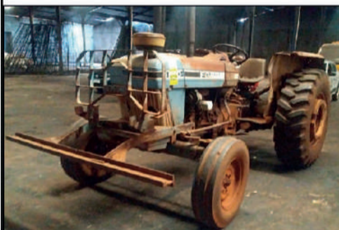
PREFEITURA - IPAUSSU