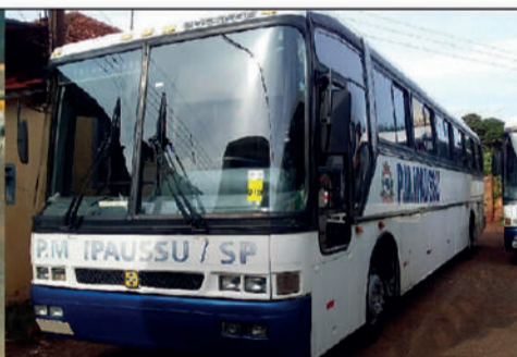
📅 24/04/2024 • ÀS 14:00