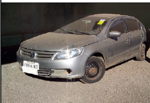
PREFEITURA - CAJURU