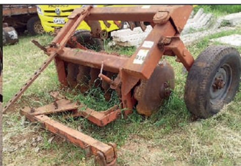
📅 15/07/2024 • ÀS 10:00