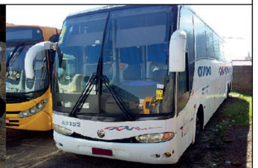
📅 25/07/2024 • ÀS 09:00

Veículos com direito a documento: FORD/FORD F 1000, FIAT/DOBLO RONTAN AMB2, GM/CHEVROLET 11000, ÔNIBUS M.BENZ/OF 1620, VW/VOYAGE 1.6. Sucata veicular. Sucata mista para reciclagem entre outros. Relação completa e fotos, no site. Condições de pagamento à vista. Leiloeiro Administrativo Wagner Félix Da Silva. O leilão será realizado exclusivamente online, através da Plataforma: www.sumareleiloes.com.br. Consulte o edital completo. [4380]