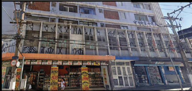
Processo: 1012110-60.2023.8.26.0114 8ª Vara Cível da Comarca de Campinas - SP