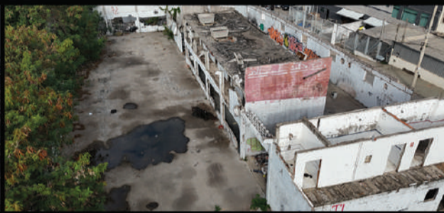
Processo: 0010331-39.2013.8.26.0114 5ª Vara Cível de Campinas - SP