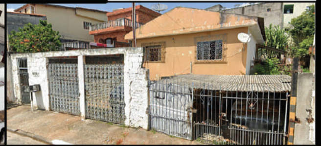
Processo: 0078005-03.2018.8.26.0100 34ª Vara Cível do Foro Central de São Paulo - SP