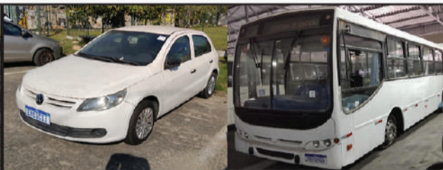
PREFEITURA - PRAIA GRANDE

1º leilão: Iniciaré no primeiro dia útil subsequente ao da publicação do edital e encerrará no dia 07/04/2026 às 10:00, por valor igual ou superior ao da avaliação. 2º leilão: Iniciaré imediatamente após o encerramento do 1º leilão e se encerrará no dia 29/04/2026 às 10:00, por valor não inferior a 60% da avaliação. Descrição do bem: GM/CELTA 2P SPIRIT, 06/07, DUG0D68, 9BGRX08907G146835, 00890813850. Pagamento: A arrematação far-se-á mediante pagamento à vista do preço pelo arrematante, no prazo de 24h (vinte e quatro horas) da realização do leilão (art. 884, inciso IV, do CPC). Da visitação: Os interessados nos bens objeto do leilão poderão vistoriá-los em sua localização, cujas informações estão disponíveis no endereço eletrônico do Leiloeiro www.sumareleiloes.com.br , ou nos autos do processo. Dos ônus: O arrematante recebe o bem livre de ônus, débitos e constrições, incluindo os débitos fiscais e tributários conforme artigo 130, parágrafo único, do Código Tributário Nacional, haja vista os débitos de natureza propter rem, que serão de responsabilidade do arrematante, quando o valor da arrematação não for capaz de supri-los. Do condutor do leilão: Gustavo Moretto Guimarães de Oliveira, devidamente inscrito na JUCESP sob o nº 640 e habilitado no Tribunal de Justiça do Estado de São Paulo – TJSP, através do portal www.sumareleiloes.com.br . Consulte o edital completo. [4947]