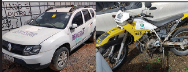
PREFEITURA - VALINHOS