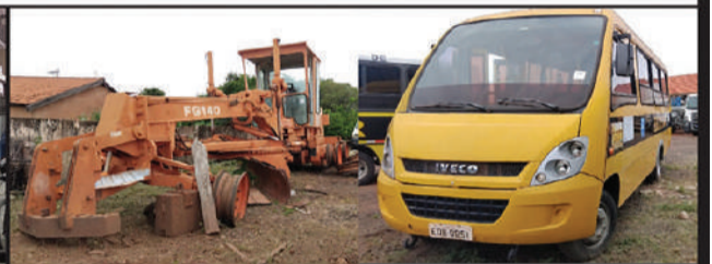
PREFEITURA - CAIUÁ

1º leilão: Iniciaré no primeiro dia útil subsequente ao da publicação do edital e encerrará no dia 07/04/2026 às 14h00, por valor igual ou superior ao da avaliação. 2º leilão: Iniciaré imediatamente após o encerramento do 1º leilão e se encerrará no dia 30/04/2026 às 14h00, por valor não inferior a 60% da avaliação. Descrição do bem: FIAT/DOBLO CARGO, 02/02, DHW9013, 9BD22315622003059, 00798421290. Pagamento: A arrematação far-se-á mediante pagamento à vista do preço pelo arrematante, no prazo de 24h (vinte e quatro horas) da realização do leilão (art. 884, inciso IV, do CPC). Da visitação: Os interessados nos bens objeto do leilão poderão vistoriá-los em sua localização, cujas informações estão disponíveis no endereço eletrônico do Leiloeiro www.sumareleiloes.com.br , ou nos autos do processo. Dos ônus: O arrematante recebe o bem livre de ônus, débitos e constrições, incluindo os débitos fiscais e tributários conforme artigo 130, parágrafo único, do Código Tributário Nacional, haja vista os débitos de natureza propter rem, que serão de responsabilidade do arrematante, quando o valor da arrematação não for capaz de supri-los. Do condutor do leilão: Gustavo Moretto Guimarães de Oliveira, devidamente inscrito na JUCESP sob o nº 640 e habilitado no Tribunal de Justiça do Estado de São Paulo – TJSP, através do portal www.sumareleiloes.com.br . Consulte o edital completo. [4978]