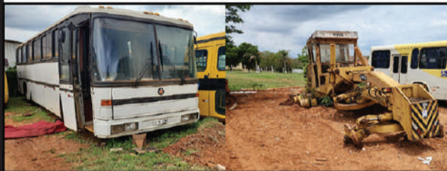
PREFEITURA - GUAPIAÇU

E PODE SER A SUA PRÓXIMA GRANDE OPORTUNIDADE!