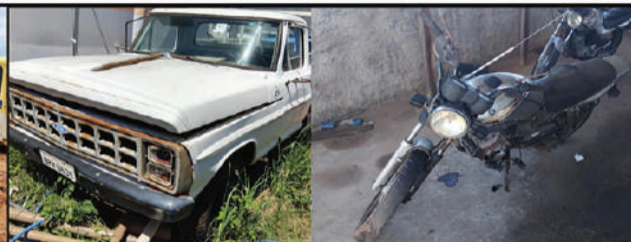
SAAE - POMPEIA

A PREFEITURA DO MUNICÍPIO DE GUAPIAÇU torna público para conhecimento dos interessados pessoas físicas e jurídicas, que fará realizar licitação na modalidade LEILÃO, do tipo maior lance, objetivando a venda de bens móveis no estado em que se encontram, cuja relação, descrição e quantitativos encontram-se no edital disponibilizado no site ( www.sumareleiloes.com.br ). A sessão pública será realizada dia 12/05/2026 a partir das 11:00 horas na modalidade "on line", através da internet, pelo Leiloeiro Administrativo. Os interessados poderão visitar os bens de 14 de abril a 8 de maio de 2026, das 9h às 16h devendo ser agendadas previamente pelo telefone (17) 3267-1241 ou pelo e-mail: patio@guapiacu.sp.gov.br . [4982]