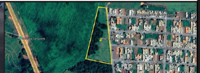
PREFEITURA - JALES

O SERVIÇO AUTÔNOMO DE ÁGUA E ESGOTOS DE POMPEIA, torna público para conhecimento dos interessados pessoas físicas e jurídicas, que fará realizar licitação na modalidade LEILÃO, do tipo maior lance, objetivando a venda de bens móveis no estado em que se encontram, cuja relação, descrição e quantitativos encontram-se no edital disponibilizado no site ( www.sumareleiloes.com.br ). A sessão pública será realizada dia 12/05/2026 a partir das 10:00 horas na modalidade "on line", através da internet, por leiloeiro Administrativo. Os interessados poderão visitar os bens nos dias: dia 08 de maio de 2026 e dia 11 de maio de 2026 das 09h00 às 15:00. [5190]