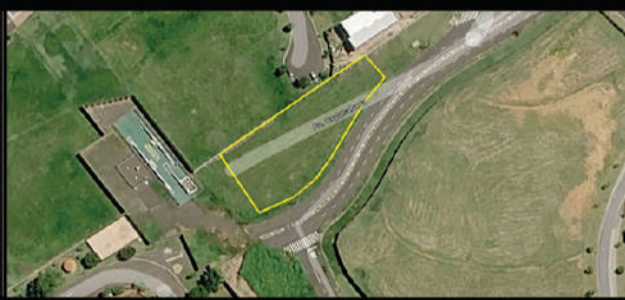
Processo: 1181262-51.2023.8.26.0100 2ª Vara de Falências e Recuperações Judiciais do Foro Central/SP