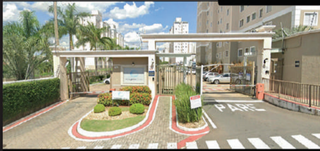
Processo: 1017774-82.2017.8.26.0114 8ª Vara Cível de Campinas - SP

E PODE SER A SUA PRÓXIMA GRANDE OPORTUNIDADE!