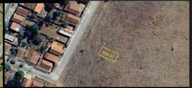
Processo: 1157070-54.2023.8.26.0100 21ª Vara Cível do Foro Central Cível de São Paulo/SP