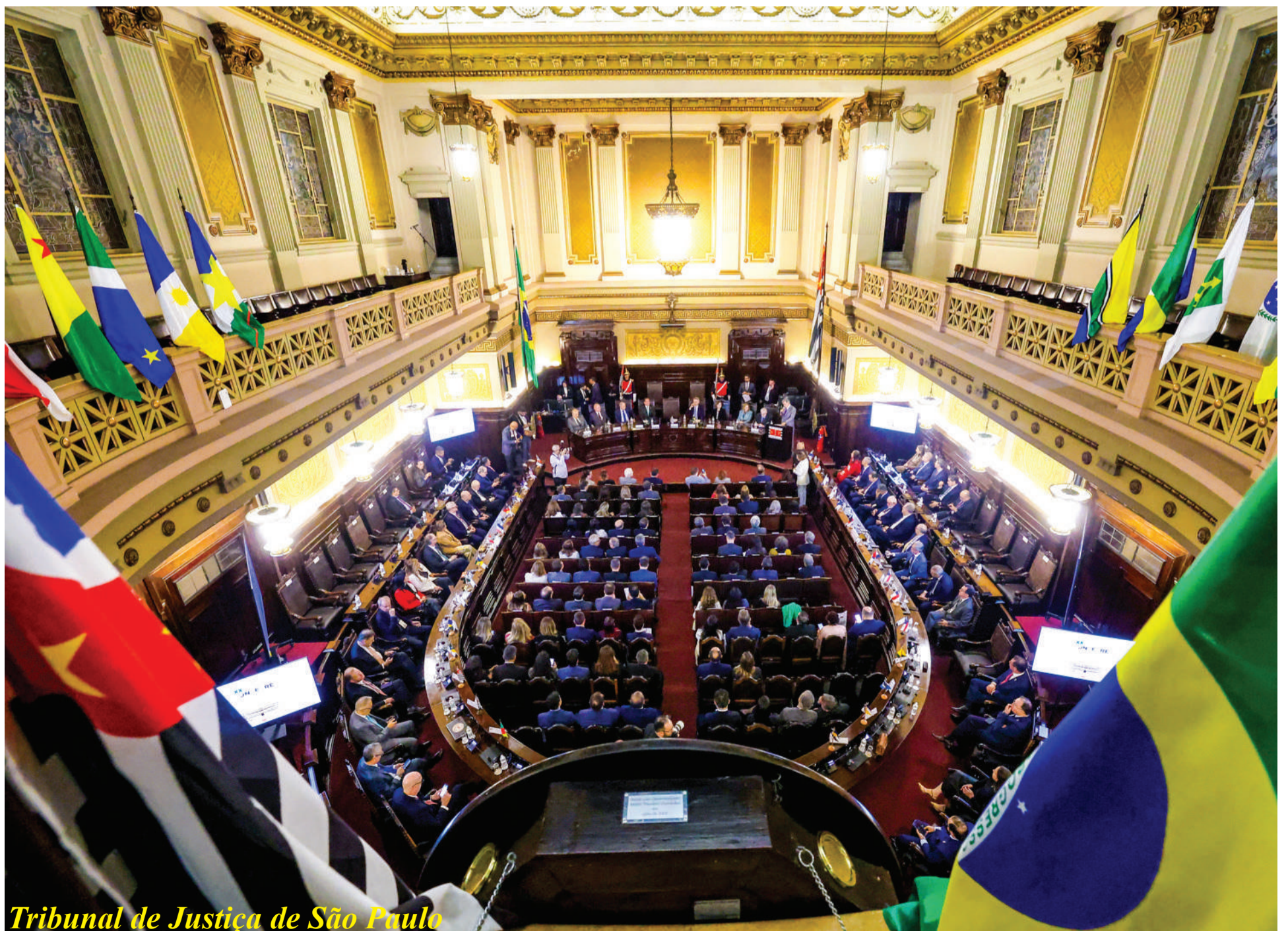
Tribunal de Justiça de São Paulo

Pauta: Tecnologia e eficiência pautam encontro histórico do Judiciário em São Paulo